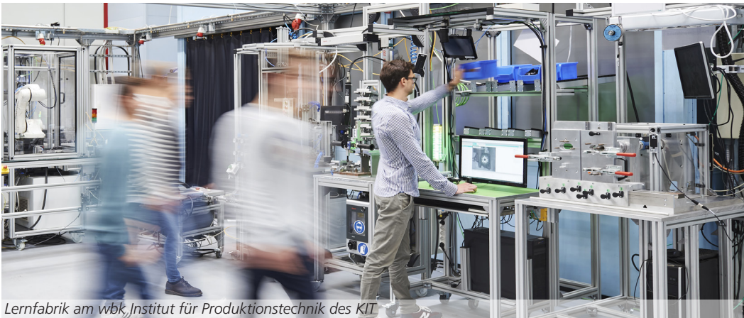
Lernfabrik am wbk Institut für Produktionstechnik des KIT

Zum Abschluss der Schulung wird das neu erworbene Wissen in ein konkretes Innovationsprojekt aus dem Arbeitsumfeld Ihres Unternehmens umgesetzt.